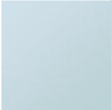
Vedplante i højmosen Dun-birk