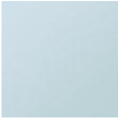
Blomst på højmosens tuer Soldug